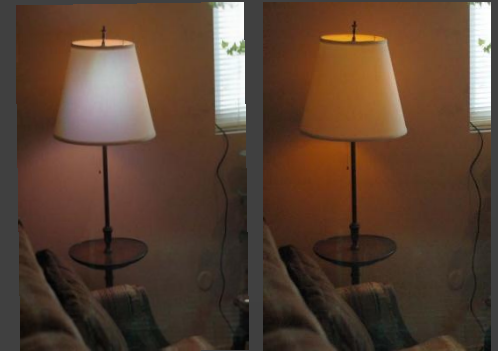
The Local Energy Lamp